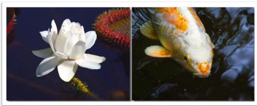
Anima natura I (Wasser) Diptychon 2 x 30 x 40cm